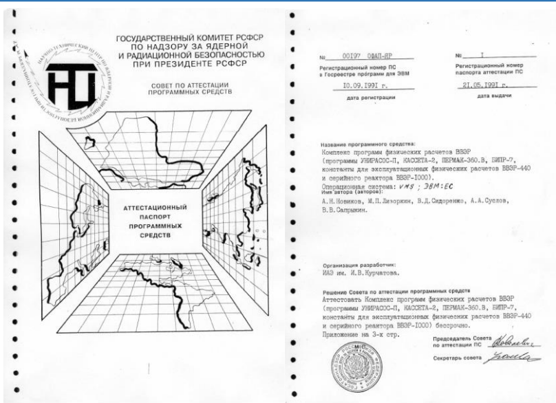
Рис. 1. Первенец

К настоящему времени наибольшее количество программ аттестовано именно по Секции № 1. С 1993 г. начала разворачиваться аттестация программ в других предметных областях.