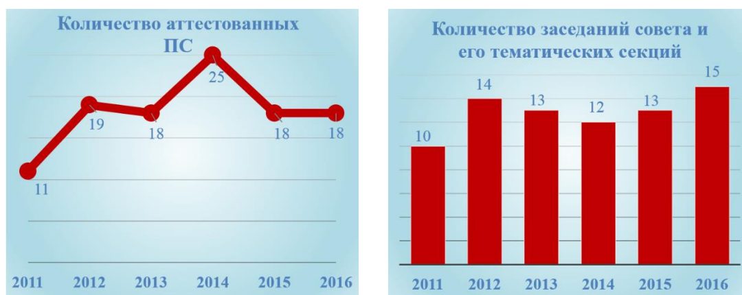
Рис. 2. Динамика работы Совета по аттестации ПС и его тематических секций