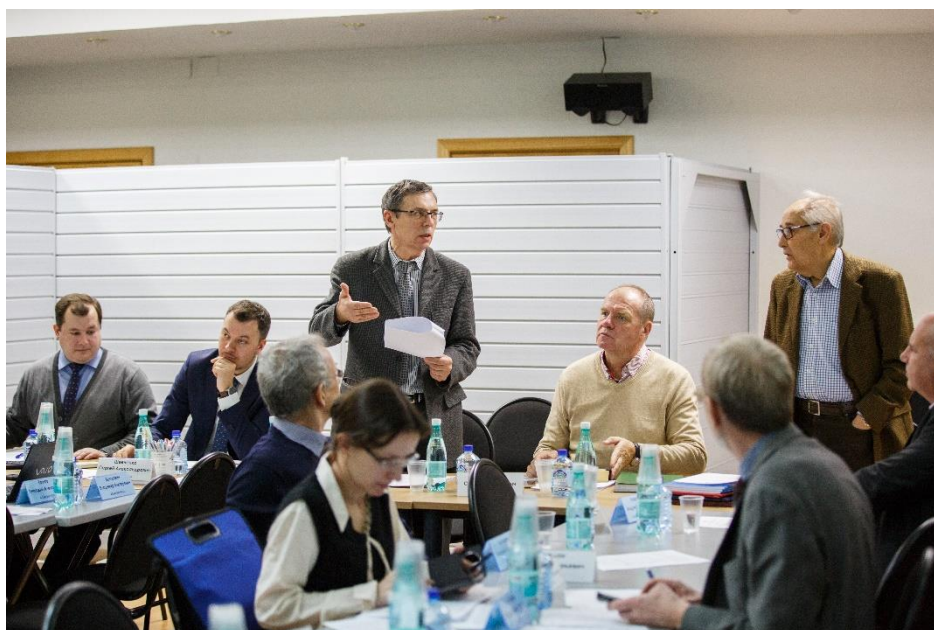
Обсуждение острых проблем