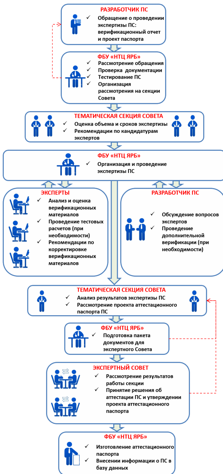
Рис. 1. Основные этапы процедуры экспертизы и аттестации ПС