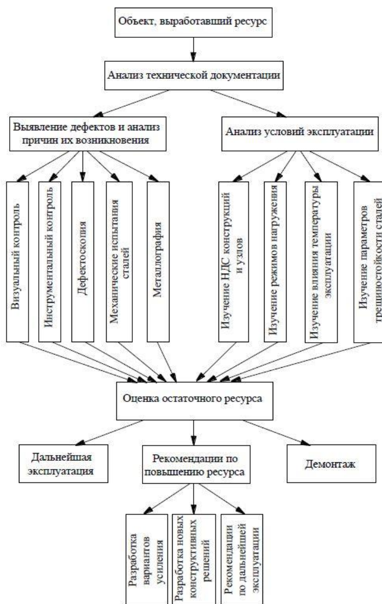
Рис. 1. Алгоритм оценки остаточного ресурса строительных конструкций объектов использования атомной энергии

138. Основные этапы процесса определения остаточного ресурса ОИАЭ показаны на структурной схеме (рис. 1).